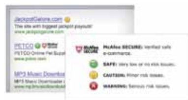
Obrázek 3. Díky snadno pochopitelných ikonám, které vás provedou vyhledáváním, víte, jestli je webová stránka bezpečná, ještě než na ni kliknete.

(Zdokonalený) McAfee SiteAdvisor® – umožňuje ověřit bezpečnost webové stránky dříve, než na ni kliknete, čímž brání malwarovým hrozbám. Díky dokonalejší ochraně před hrozbami typu „phishing“ jste upozorněni na stránky, které mohou odcizit vaši identitu nebo se dostat k vašim finančním informacím.