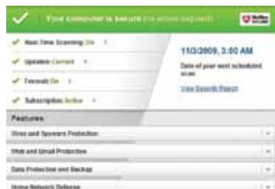
Obrázek 1. Úvodní obrazovka se srozumitelným panelem zabezpečení a stavovou oblastí.

Program McAfee Internet Security 2011 se snadno používá. Díky zcela přepracovanému vzhledu hlavní obrazovky získáváte při prvním pohledu všechny informace, které potřebujete.