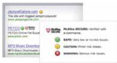
Figura 3. Le icone intuitive guidano l'utente durante le ricerche, fornendo indicazioni sulla sicurezza di un sito web prima di fare clic su un collegamento.

McAfee SiteAdvisor® (ottimizzato) —Informa della presenza di rischi in un sito web ancora prima di accedervi per bloccare le minacce malware. La protezione "antiphishing" avanzata segnala siti web che potrebbero cercare di rubare la tua identità o di accedere alle tue informazioni finanziarie.