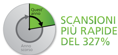
Figura 2. Scansioni successive più veloci del 327%.

Quest'anno McAfee AntiVirus Plus è stato completamente riprogettato, quindi è più veloce che mai.