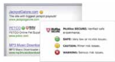
Figura 3. Os ícones fáceis de compreender ajudam-no a efectuar pesquisas, para que saiba se um website é seguro antes de clicar numa ligação.

Better protection against dangerous websites McAfee SiteAdvisor (Melhorado) ®—Ajuda-o a saber se um website é seguro antes de clicar, de forma a evitar ameaças de malware. A protecção avançada contra “phishing” alerta-o relativamente aos websites que podem tentar roubar a sua identidade ou obter acesso às suas informações financeiras.