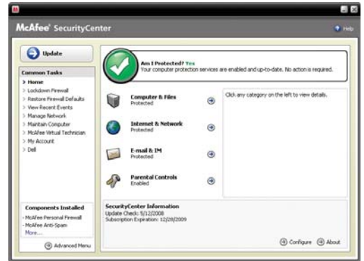
方便易用、界面直观的“安全控制台”

请注意：安装此安全软件需要先连接至 Internet，这同时也是为了确保软件可以自动更新和升级，使其始终处于最新状态。