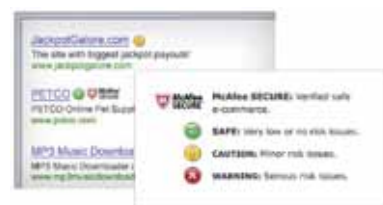
Figura 3. Con iconos fáciles de entender que le ayudan a guiar sus búsquedas, sabrá si un sitio web es seguro antes de que pulsar sobre un vínculo.

McAfee SiteAdvisor® (mejorado) —Le ayuda a saber si un sitio web es seguro antes de pulsar en él para detener las amenazas de malware. La protección contra “phishing” avanzada le avisa de los sitios web que pueden intentar robar su identidad o acceder a su información financiera.