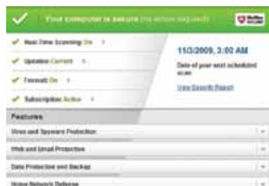
Figura 1. Pantalla Inicio con barra de seguridad muy fácil de comprender y área de estado

McAfee Internet Security 2011 es sinónimo de facilidad de uso. La pantalla de inicio, que se ha renovado totalmente, le proporciona toda la información que necesita con tan solo echar un vistazo.