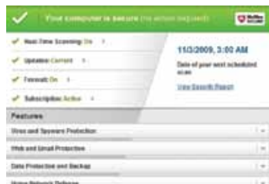
Figure 1. Écran d'accueil avec barre de sécurité et zone d'état faciles à comprendre.

McAfee AntiVirus Plus 2011 : la facilité d'utilisation est au cœur de tout. L'écran d'accueil entièrement repensé vous permet d'accéder à toutes les informations dont vous avez besoin d'un seul coup d'œil.