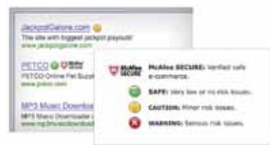
Figure 3. Grâce à des icônes faciles à comprendre qui vous guident dans vos recherches, vous savez si un site web est sûr avant même d'y accéder.

McAfee SiteAdvisor® (amélioration) —Vous aide à savoir si un site web est sûr avant même d'y accéder pour stopper les menaces issues de logiciels malveillants. La protection antiphishing avancée vous prévient si vous tentez d'accéder à des sites web susceptibles de dérober votre identité ou d'accéder à vos informations financières.