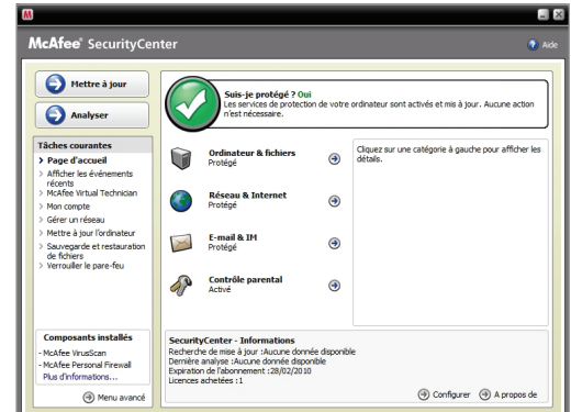
« Console de sécurité » conviviale et intuitive

Remarque : une connexion à Internet est indispensable pour installer ce logiciel de sécurité, recevoir les mises à jour automatiques ainsi que les mises à niveau et ainsi bénéficier d'une protection actualisée.