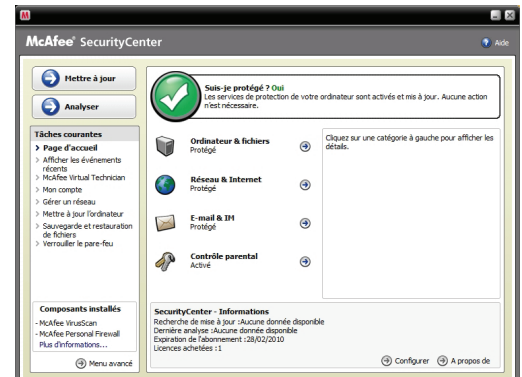
« Console de sécurité » conviviale et intuitive

Remarque : une connexion à Internet est indispensable pour installer ce logiciel de sécurité, recevoir les mises à jour automatiques ainsi que les mises à niveau et ainsi bénéficier d'une protection actualisée.