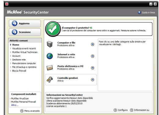
Console di protezione facile da utilizzare e intuitiva

Nota: per poter installare il software e ricevere gli aggiornamenti automatici che consentono di mantenere aggiornata la protezione è necessario disporre di una connessione a Internet.