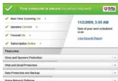
Figura 1. Schermata principale con una barra di sicurezza e un'area di stato intuitive.

Il valore di McAfee Internet Security 2011 risiede nella sua facilità d'uso. La schermata principale, completamente riprogettata, offre una visualizzazione immediata di tutte le informazioni necessarie.