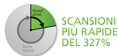
Figura 2. Scansioni successive più veloci del 327%.

Quest'anno McAfee Internet Security è stato completamente riprogettato, quindi è più veloce che mai.