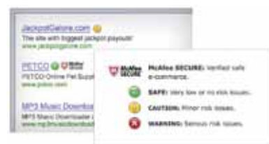
Figura 3. Le icone intuitive guidano l'utente durante le ricerche, fornendo indicazioni sulla sicurezza di un sito web prima di fare clic su un collegamento.

McAfee SiteAdvisor® (ottimizzato) —Informa della presenza di rischi in un sito web ancora prima di accedervi per bloccare le minacce malware. La protezione "antiphishing" avanzata segnala siti web che potrebbero cercare di rubare la tua identità o di accedere alle tue informazioni finanziarie.