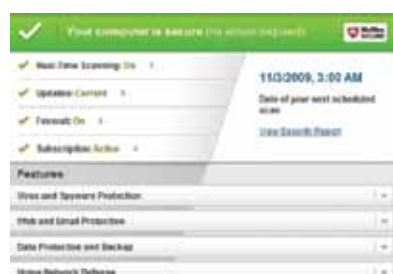
Figura 1. Schermata principale con una barra di sicurezza e un'area di stato intuitive.

Il valore di McAfee Total Protection 2011 risiede nella sua facilità d'uso. La schermata principale, completamente riprogettata, offre una visualizzazione immediata di tutte le informazioni necessarie.