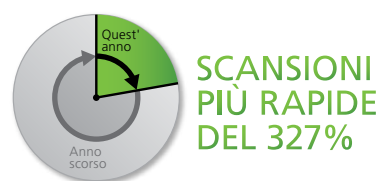
Figura 2. Scansioni successive più veloci del 327%.

Quest'anno McAfee Total Protection è stato completamente riprogettato, quindi è più veloce che mai.