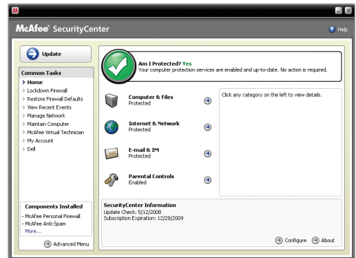
Console di protezione facile da utilizzare e intuitiva

Nota: per poter installare il software e ricevere gli aggiornamenti automatici che consentono di mantenere aggiornata la protezione è necessario disporre di una connessione a Internet.