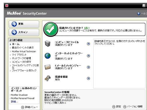
使いやすい直感的な「セキュリティコンソール」

注: インストール時、自動更新およびアップグレード時には、インターネットに接続する必要があります。